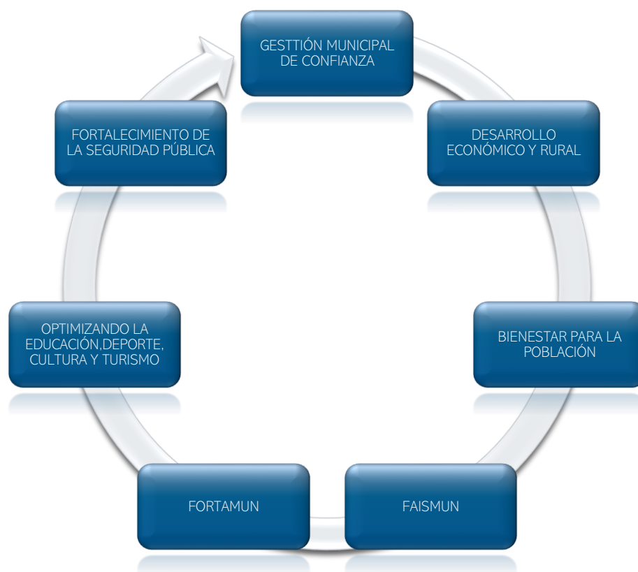
Tabla 1. Programas Presupuestarios 2023

El monitoreo y seguimiento se llevará a cabo de forma trimestral, midiendo su avance y observando que la asignación de recursos guarde relación con los objetivos, metas y prioridades contenidos en el Plan Municipal de Desarrollo 2021-2024, utilizando la Metodología del Marco lógico. Son 7 los Programas Presupuestarios del ejercicio fiscal 2022, los cuales son: