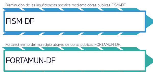
Tabla 2 Programas Presupuestarios relacionados con el FISM-DF y FORTAMUN-DF.

Las evaluaciones a los fondos federales se llevarán a cabo de forma anual, lo que permitirá medir el desempeño de las acciones comprendidas en el ejercicio fiscal inmediato anterior, dichos trabajos se vinculan en los siguientes PP a evaluar: